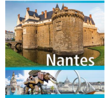
Programme DPC SF2H 2021