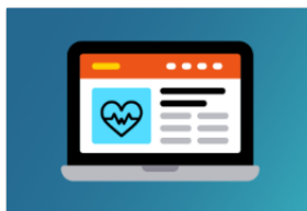
Chantier 3 : numérique