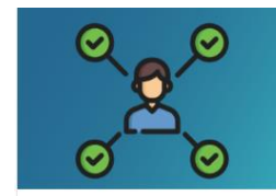
Chantier 5 : organisation territoriale