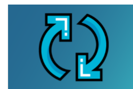
Chantier 4.2 : transformation des métiers