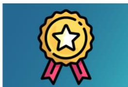
Chantier 1 : qualité et pertinence des soins